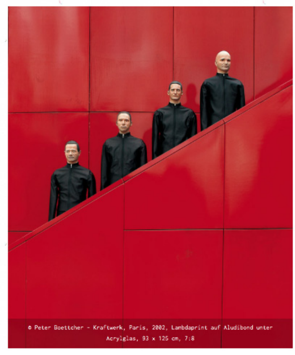
© Peter Boettcher - Kraftwerk, Paris, 2002, Lambdaprint auf Aludibond unter Acrylglas, 93 x 125 cm, 7:8